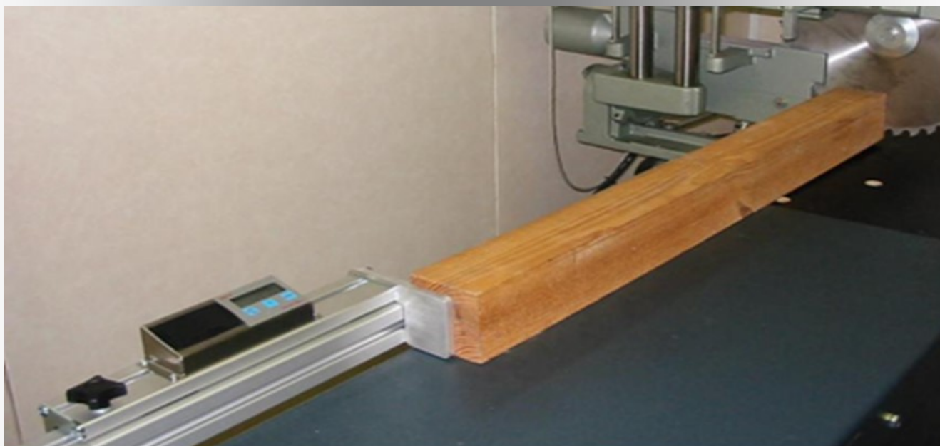
Application du bois avec un montage avant une scie