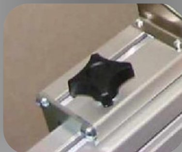
Poignée de serrage