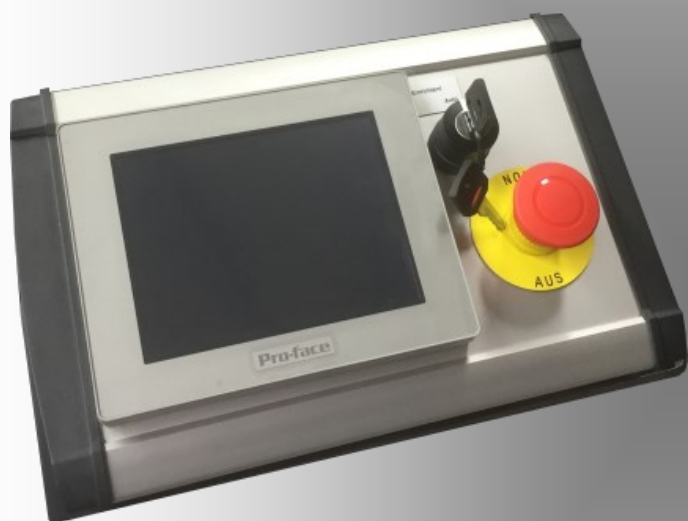
Disponible en version CN