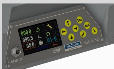
Programmation simple et intuitive

La gamme de cintreuses sans mandrin type BM est capable de cintrer des tubes du Ø 34 mm au Ø 300 mm avec une gamme de la BM34 à la BM300.