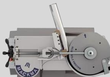
Cintrage droite / gauche