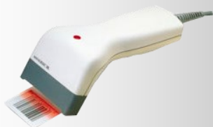
Lecteur code barre