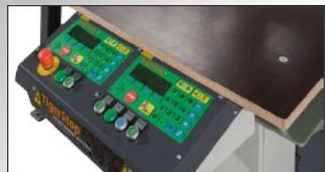
Réglage numérique des angles