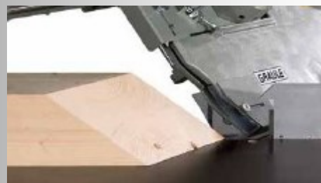
Coupe possible avec la scie radiale