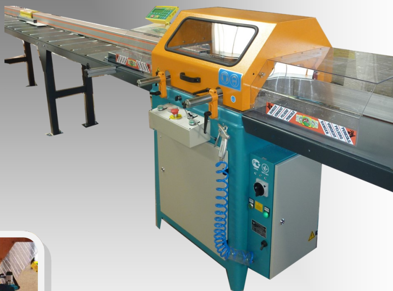
Tronçonneuse aluminium à lame ascendante avec aménagement numérique Tigerstop

Pour les versions semi-automatique la lame est orientables dans les deux sens avec en option la digitalisation de l'angle.