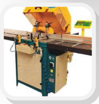
Avec aménagement numérique