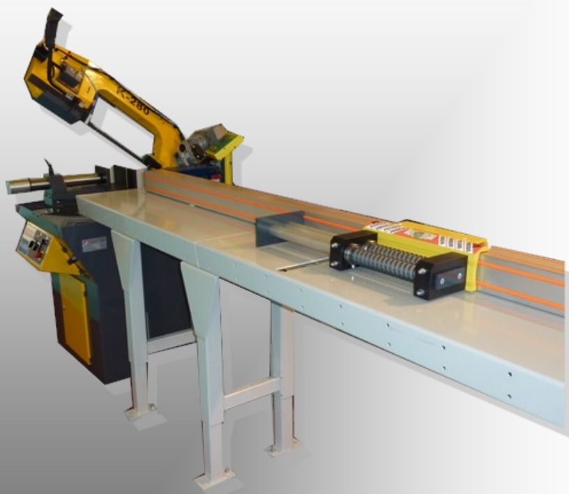
Butée automatique Tigerstop avec Scie à Ruban

Dans le cas de nos machines automatiques, l'opérateur charge d'un côté de la machine. Après validation, la butée pousse la matière aux différentes côtes et la coupe se déclenche automatiquement. L'opérateur décharge alors les pièces coupées à longueur.