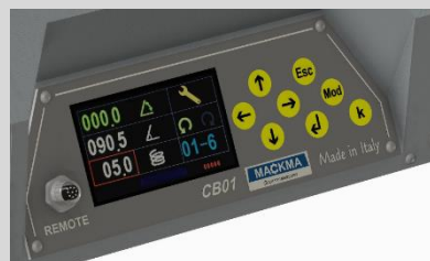
Programmation simple et intuitive

La gamme de cintreuses sans mandrin type BM est capable de cintrer des tubes du Ø 34 mm au Ø 300 mm avec une gamme de la BM34 à la BM300.