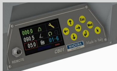
Programmation simple et intuitive

La gamme de cintreuses sans mandrin type BM est capable de cintrer des tubes du Ø 34 mm au Ø 300 mm avec une gamme de la BM34 à la BM300.